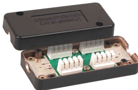
Verbindungsmodul Kat. 6+